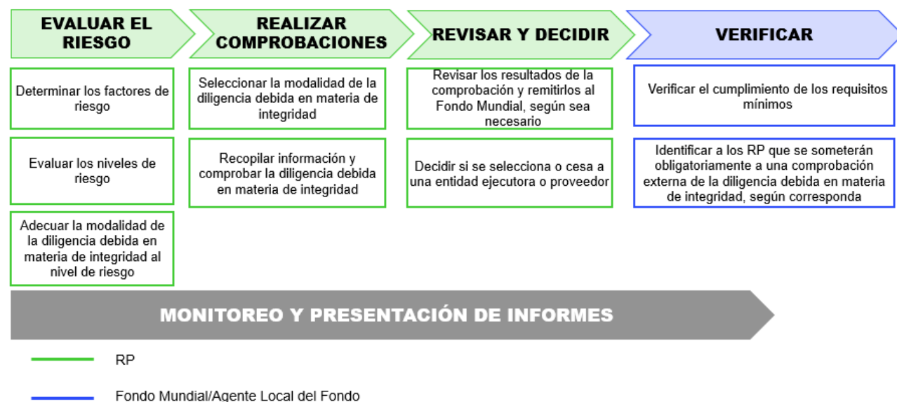
Figura 2. Etapas del proceso de Diligencia debida en materia de integridad

En la figura 2 se presenta un resumen de las etapas del proceso de Diligencia debida en materia de integridad.